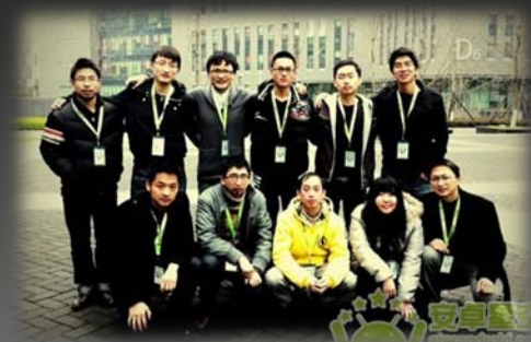
Camera 360 团队成员合影